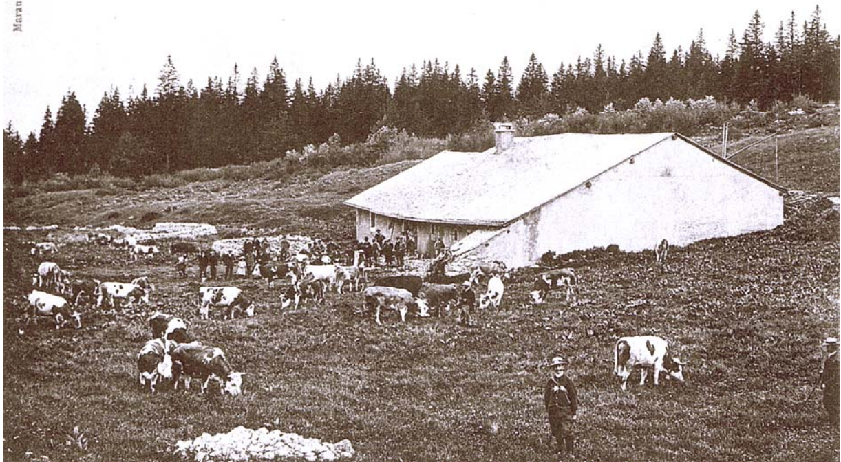
Syndicat des Longevilles (5 juin 1913). - Le Tronpeau de la Barthelette - Mont d'Or

1913, dernière saison d'alpage complète vraiment tranquille. Après l'enfer va fondre sur le pays où plus rien ne sera comme avant. Prenez donc grand plaisir à votre montée, Messieurs, Dames, et vous aussi jeunes gens qui serez appelés à aller mourir sous les obus dont la dix millième partie aurait déjà suffi à remplir votre beau chalet ! C'est là encore un instant de grâce, admirable dans ce qu'il comporte d'enseignement. Le vieux berger et ses aides sont là, qui vont accomplir la saison.