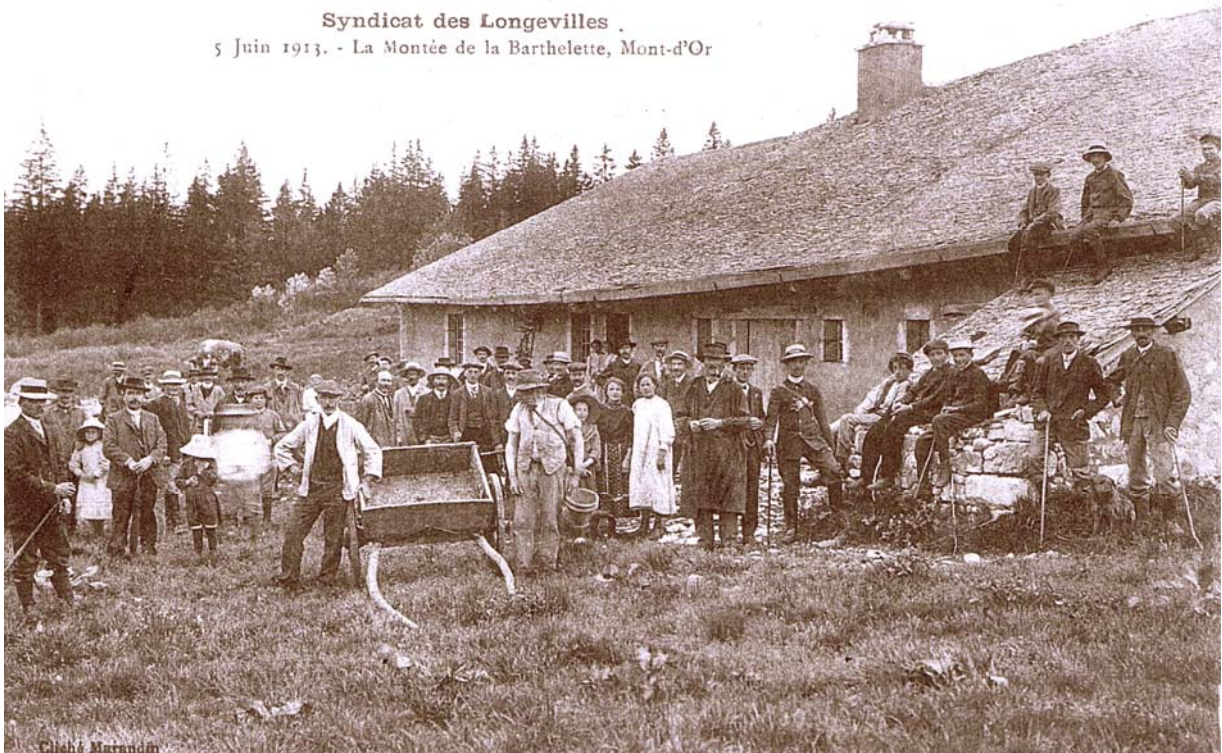
Syndicat des Longevilles . 5 Juin 1913. - La Montée de la Barthelette, Mont-d'Or

1913, dernière saison d'alpage complète vraiment tranquille. Après l'enfer va fondre sur le pays où plus rien ne sera comme avant. Prenez donc grand plaisir à votre montée, Messieurs, Dames, et vous aussi jeunes gens qui serez appelés à aller mourir sous les obus dont la dix millième partie aurait déjà suffi à remplir votre beau chalet ! C'est là encore un instant de grâce, admirable dans ce qu'il comporte d'enseignement. Le vieux berger et ses aides sont là, qui vont accomplir la saison.